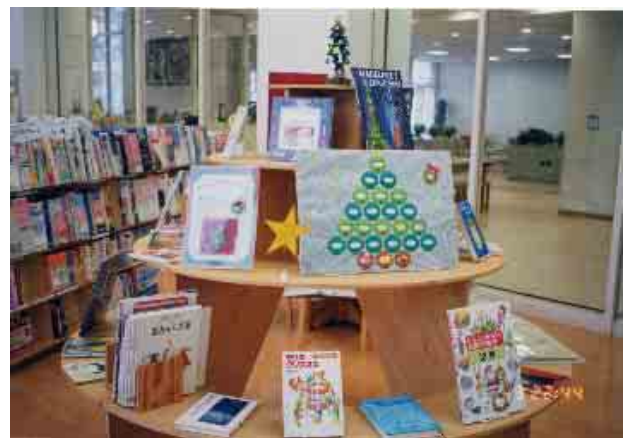
児童展示テーブル こどものほんのコーナー (H15年12月)