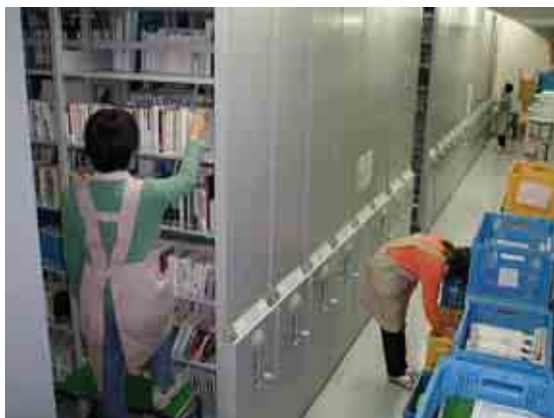
(右)書庫の様子 地下1階書庫 (H16年10月)