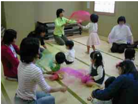
わらべうたで あそぼう!の様子 ラディアン和室 (H16年10月)