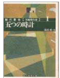
ライオン・エッセイ 柳川貴代 + Fragment

なお、この『二ノ宮心中』は1976年に編まれた鉄道アンソロジーの中で『見えない機関車』というタイトルに改題され、内容も一部書き改められて発表されています。