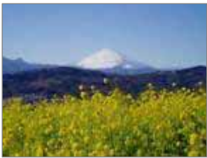
頂上からの眺望 菜の花と富士山

二宮町のほぼ中心に位置する吾妻山。町のシンボルともいえる吾妻山は、山全体をぐるりと散策道が巡り四季折々の自然を楽しめる公園として整備されています。頂上の展望台は 360 度の大パノラマで、南に広がる相模湾は、晴れた日には大島や初島も見ることができます。「関東の富士見百景」にも選ばれており、富士山をはじめ箱根や丹沢などの山々が手に取るような近さを感じられます。とくに菜の花の時期の眺望は絶景です。また、森の散策道での野鳥探索や、吾妻神社や浅間神社を巡っての歴史散策など、いろいろと見所も満載です。今回の特集では、身近な観光地、吾妻山をご紹介します。