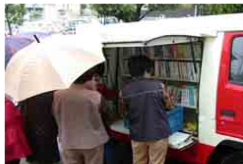
百合が丘児童館にて

百合が丘児童館では地域文庫活動として、昭和44年頃から「やまゆり会」の皆さんによって運営されています。毎年、会費で新刊本も購入しており、百合が丘の地区の方々に親しまれています。毎回図書館から100冊前後、本の貸出をしています。個人の貸出もできますので、ご利用ください。