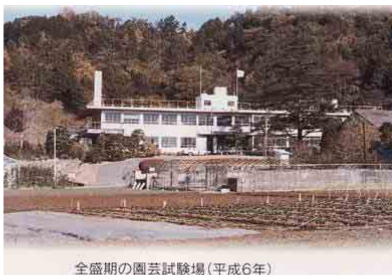
全盛期の園芸試験場(平成6年)