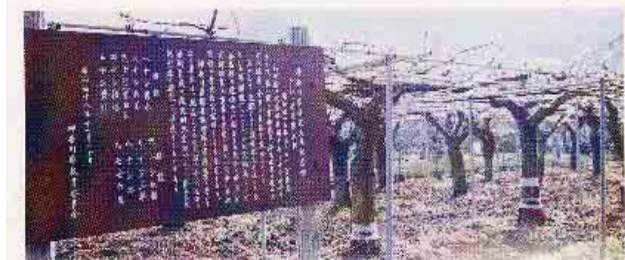
神奈川県指定天然記念物ナシの原木群

モモの原木は、「白鳳」1品種1本で、わが国の代表的な品種の一つとして、現在もモモ生産県である山梨、福島において栽培されています。